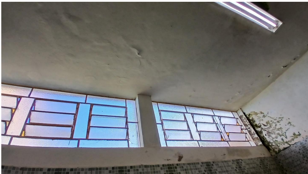
Imagem 22: Banheiro a ser reformado (Vista 03)