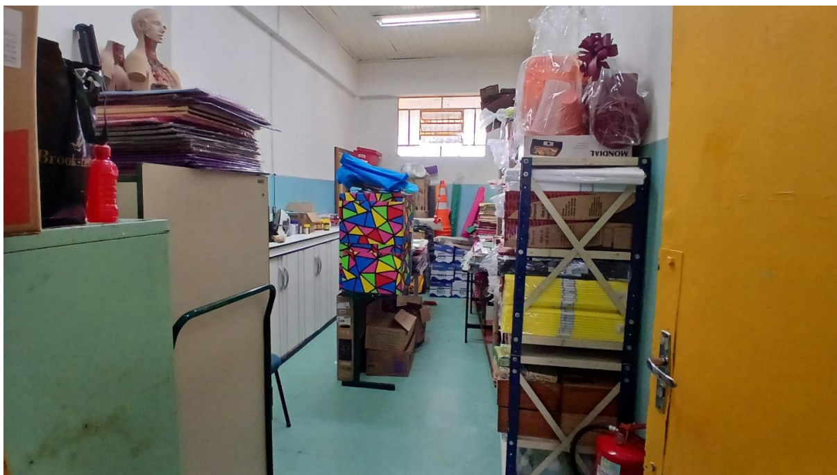
Imagem 03: Depósito a ser transformado na extensão do refeitório (Vista 01)