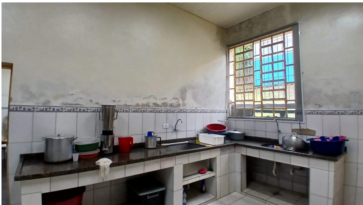
Imagem 12: Cozinha a ser refeormada