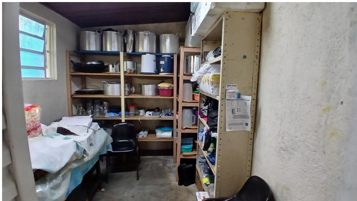
Imagem 10: Despensa 02 a ser reformada (Vista 01)