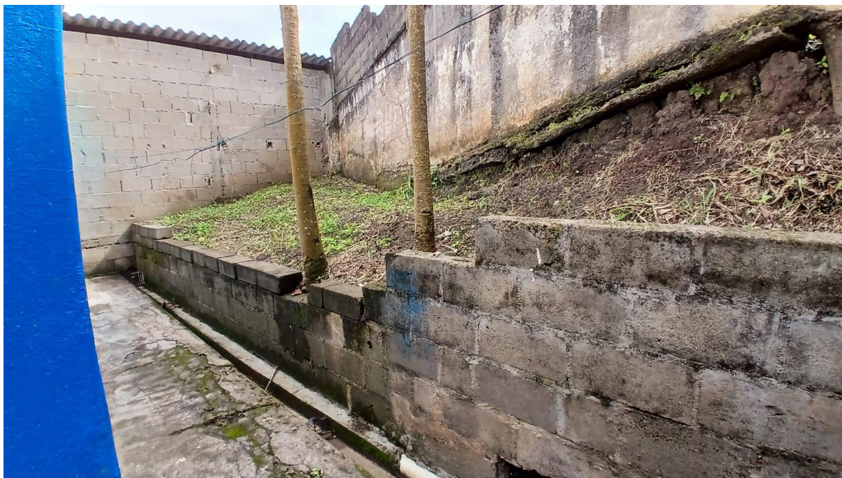
Imagem 17: Área de externa a ser reformada (Vista 02)