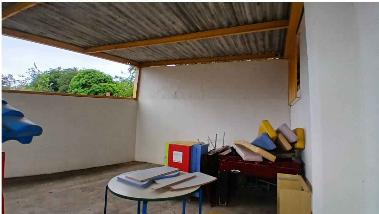
Imagem 07: Espaço a ser transformado no novo depósito (Vista 02)