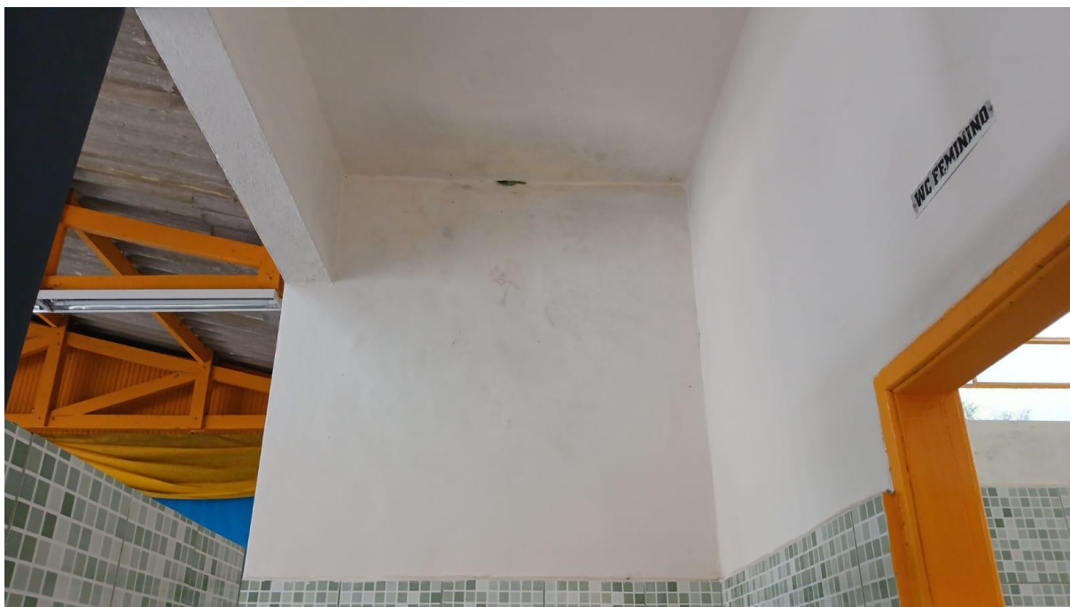
Imagem 21: Banheiro a ser reformado (Vista 02)