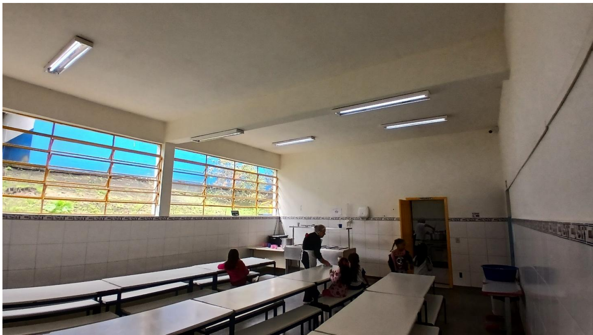
Imagem 02: Refeitório a ser ampliado (Vista 02)