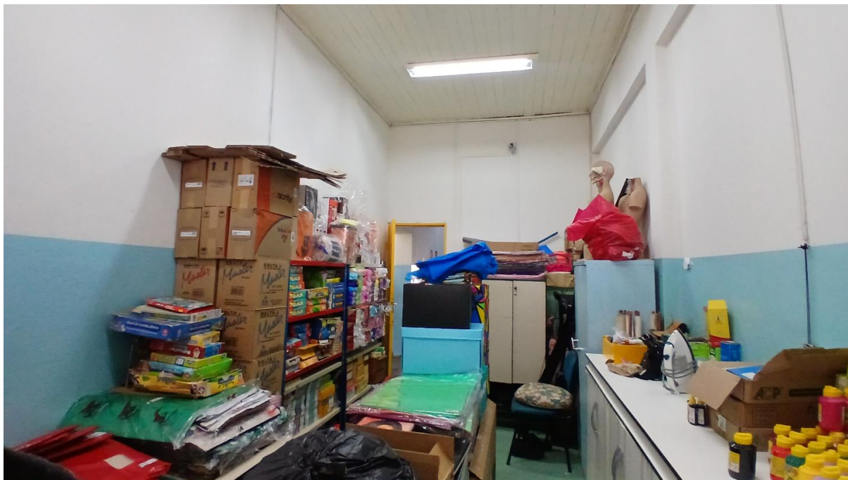
Imagem 04: Depósito a ser transformado na extensão do refeitório (Vista 02)