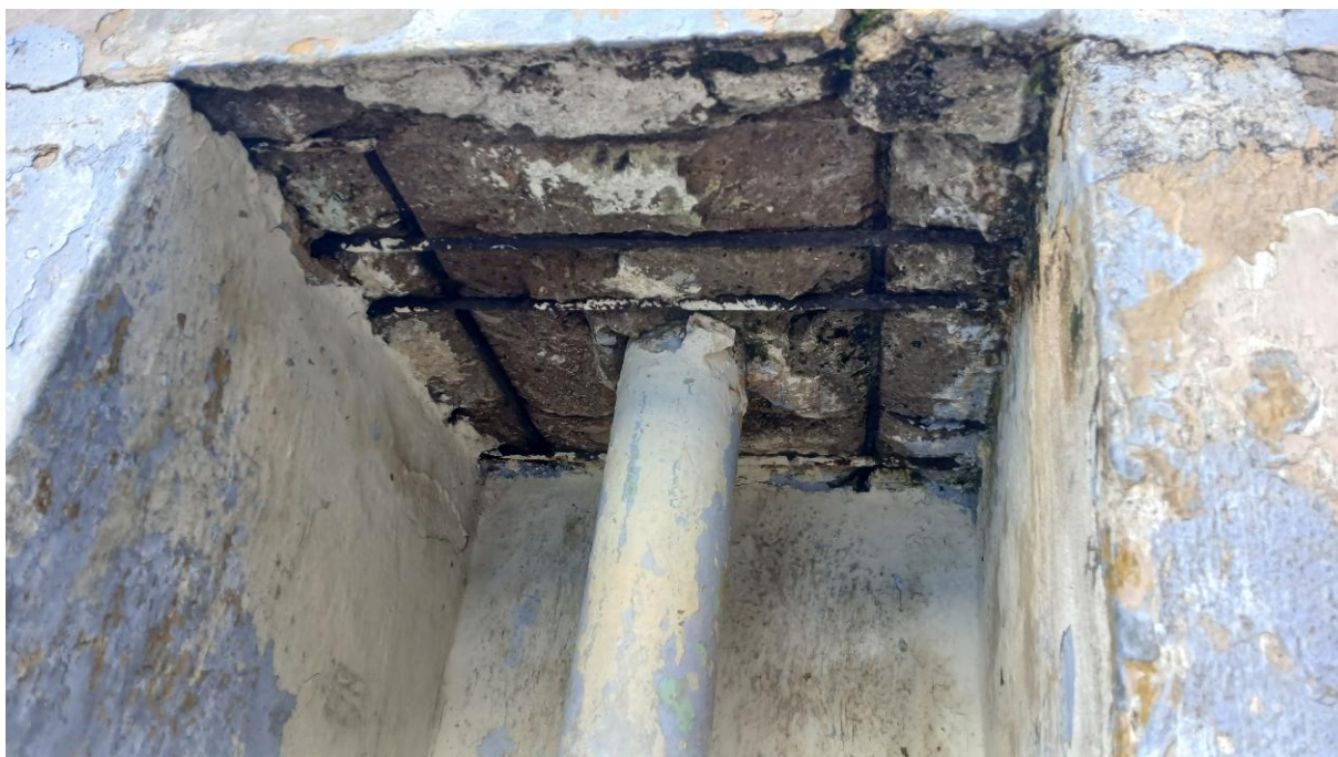
Imagem 24: Base a ser refeita para a instalação do mastro