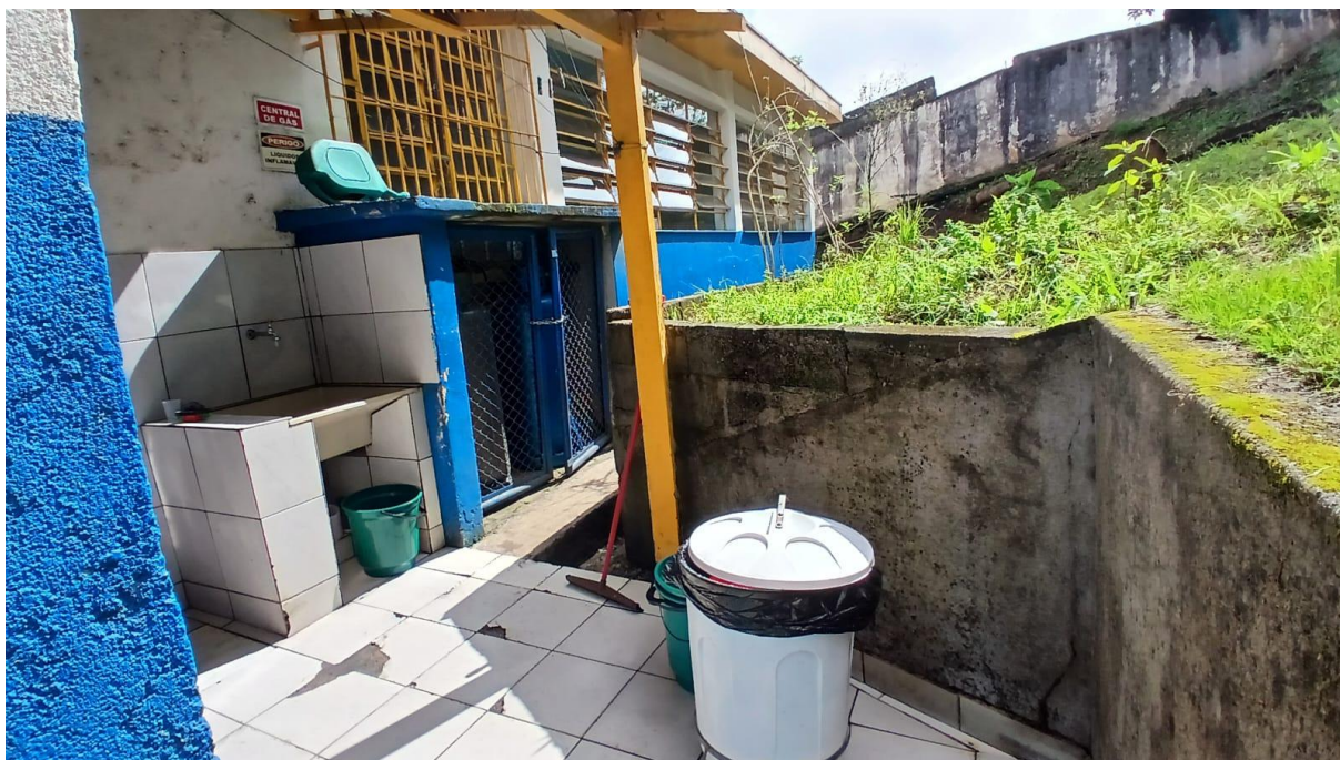
Imagem 15: Área de serviço a ser reformada (Vista 02)