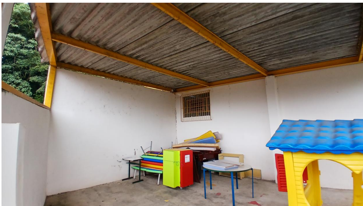
Imagem 06: Espaço a ser transformado no novo depósito (Vista 01)