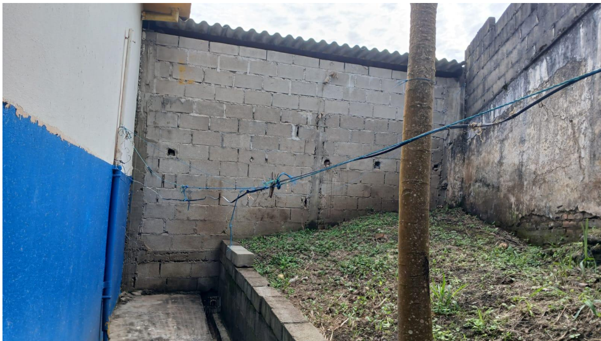
Imagem 16: Área de externa a ser reformada (Vista 01)