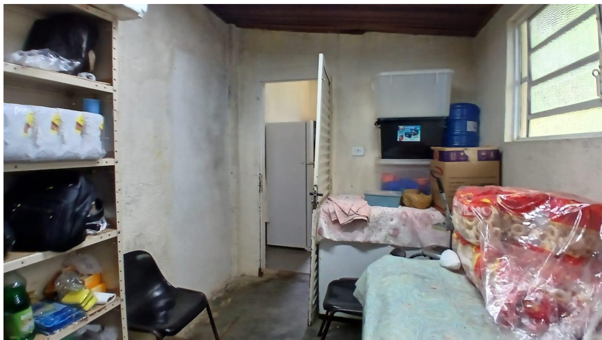
Imagem 11: Despensa 02 a ser reformada (Vista 02)