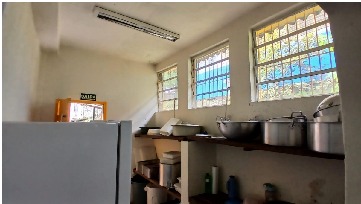
Imagem 09: Despensa 01 a ser reformada (Vista 02)