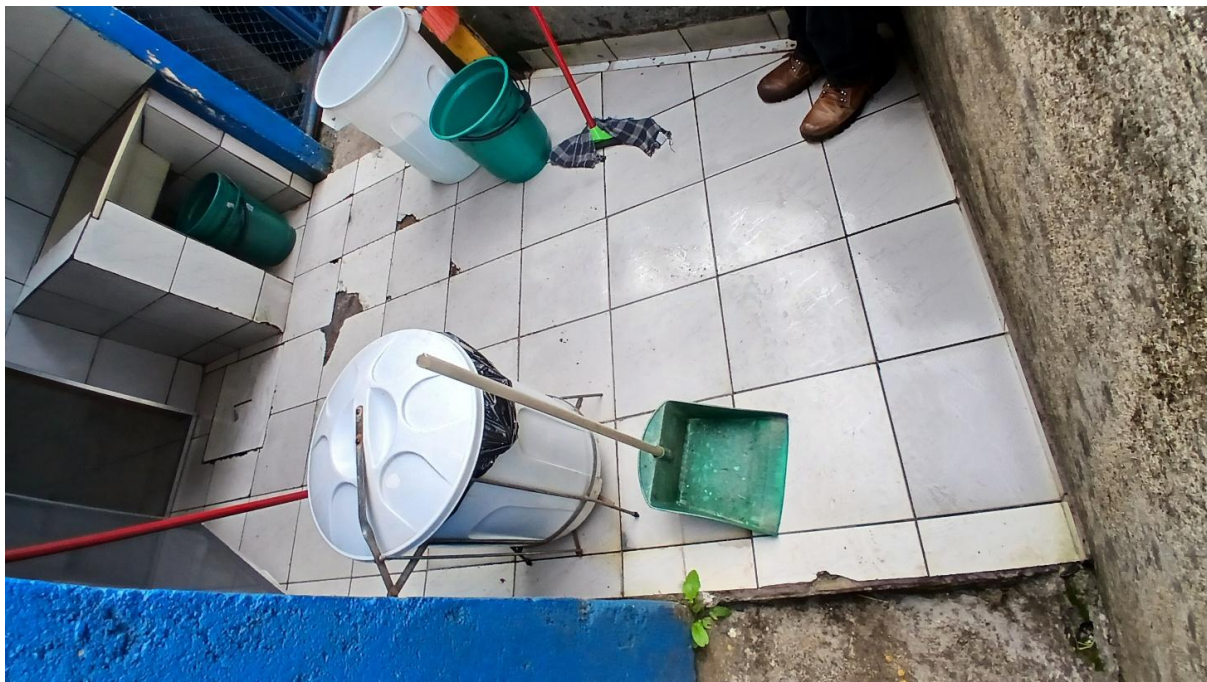
Imagem 14: Área de serviço a ser reformada (Vista 01)