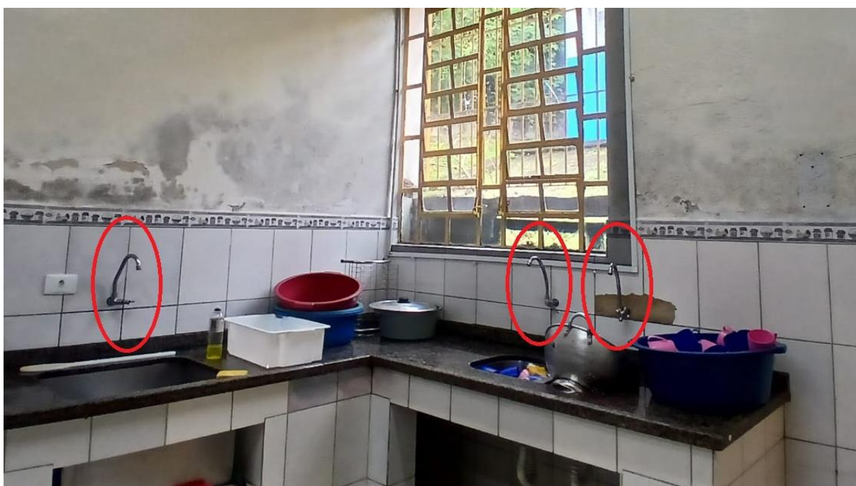
Imagem 13: Torneiras da cozinha a serem substituídas