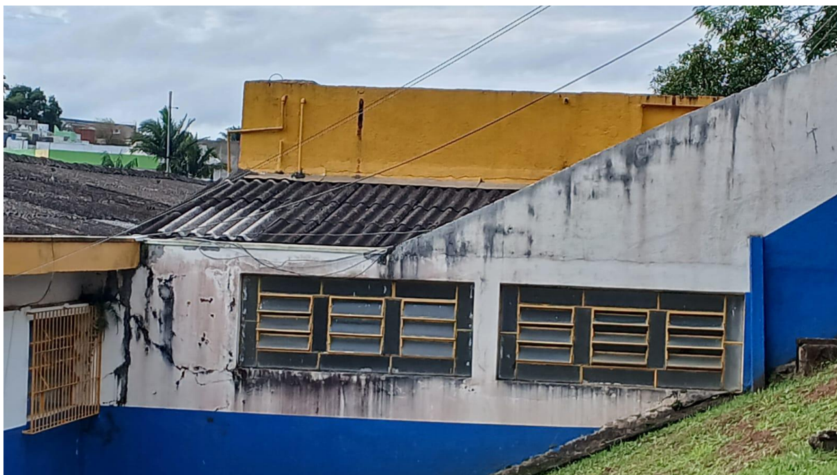
Imagem 23: Telhado do banheiro a ser reformado