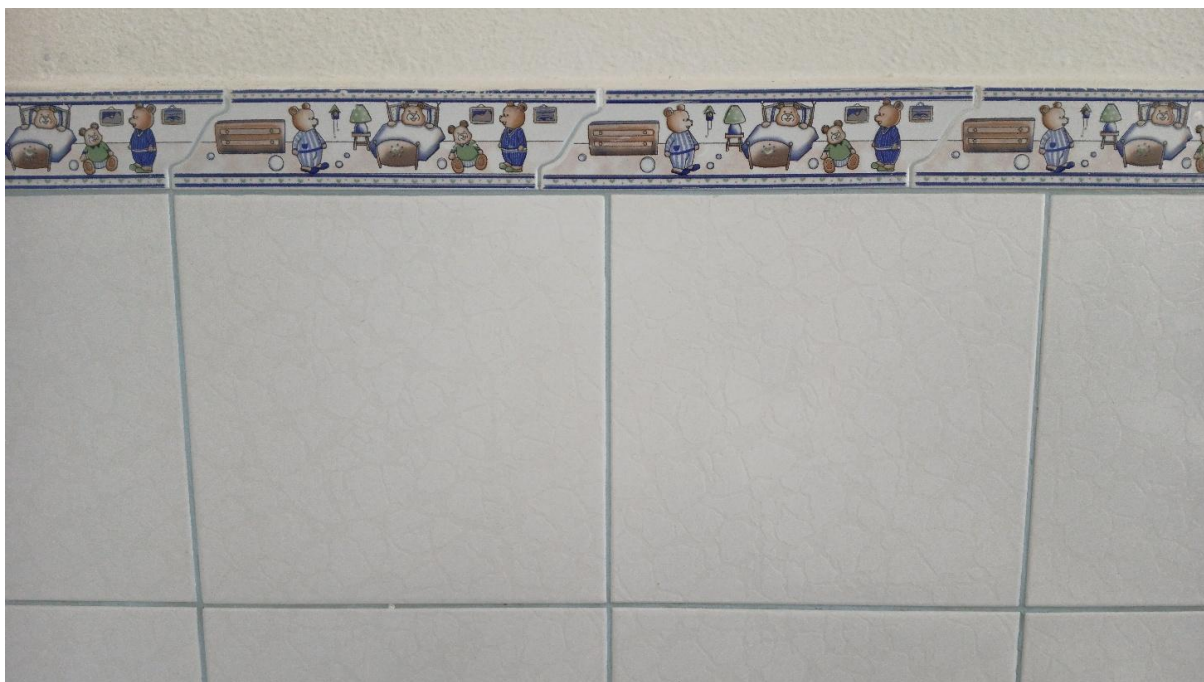
Imagem 05: Azulejo a ser instalado na extensão do refeitório