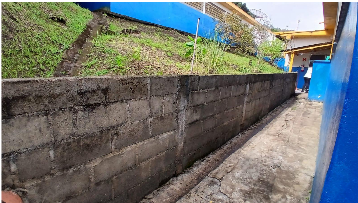
Imagem 18: Área de externa a ser reformada (Vista 03)