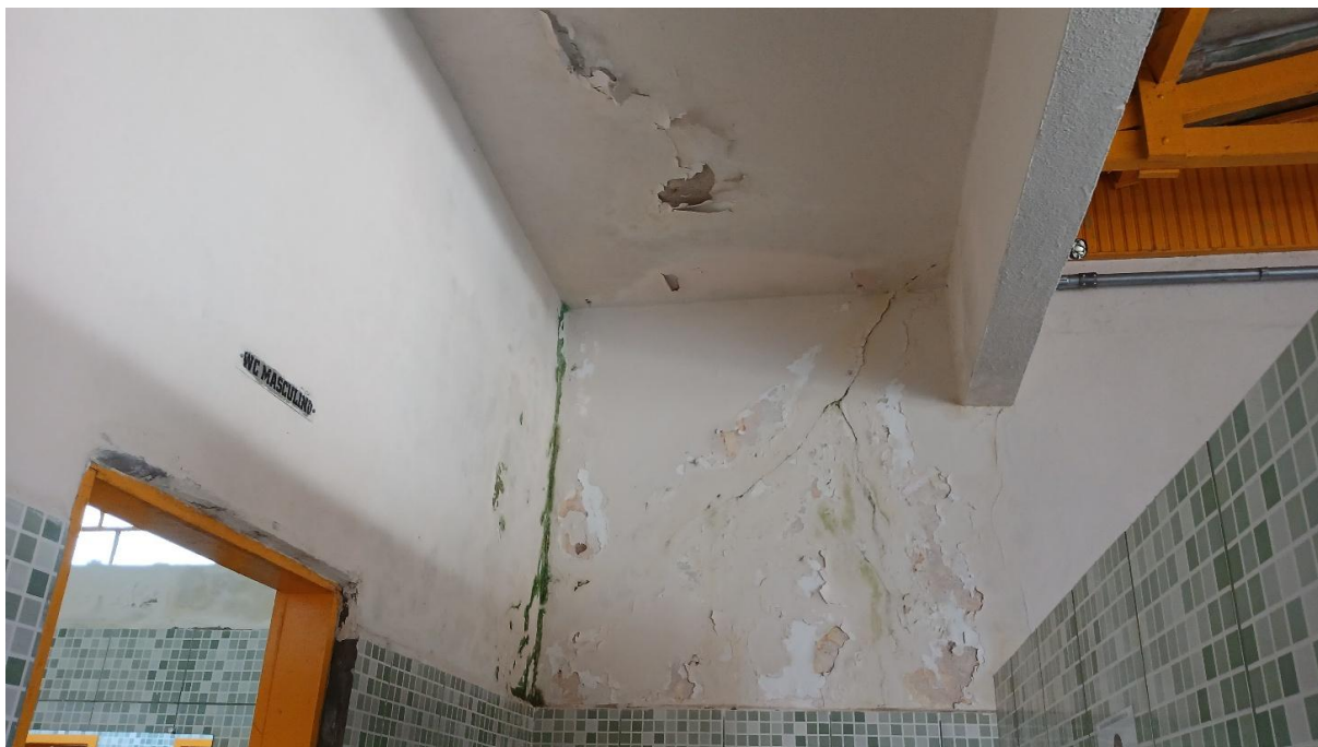
Imagem 20: Banheiro a ser reformado (Vista 01)