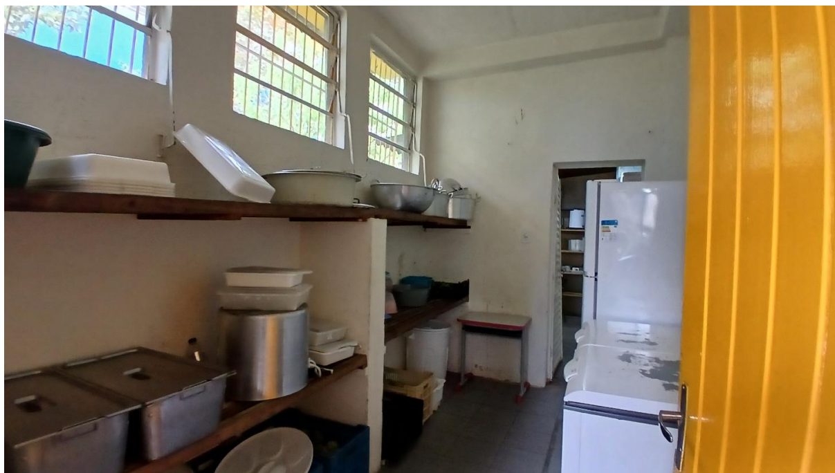
Imagem 08: Despensa 01 a ser reformada (Vista 01)